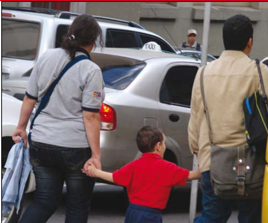
La educación y la agresividad de los hijos proviene de la enseñanza del hogar.

Esto sucede por la falta de experiencia e información que los mismos tienen, creando falsas promesas, muchos sin sabores, vacíos, pleitos, muertes y enfriamiento en cuanto al amor y la comprensión que debería existir en una verdadera familia.