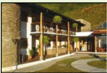
Estancia El Jarillo

El Jarillo es una buena alternativa para aquellas personas que busquen pasar unos días alejado de todo el tráfico citadino, el agitado ritmo de vida, disfrutar de la comida típica alemana y de las agradables vistas.