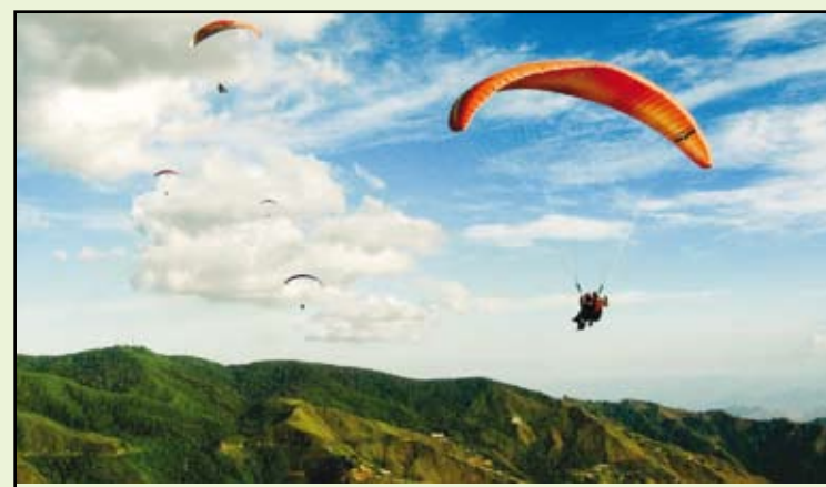
Parapentes en El Jarillo, Estado Miranda