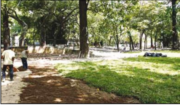
Limpieza permanente en el Parque Los Caobos

Un total de cuatro mil 300 metros cuadrados de grama han sido sembrados por la Alcaldía de Caracas en el parque Los Caobos durante este año, como parte de la política municipal de recuperación de los espacios públicos de la ciudad.