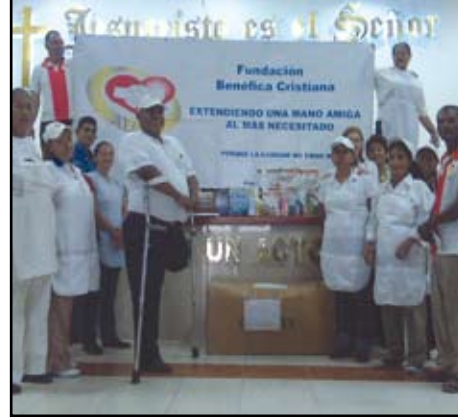
Voluntarios listos para brindar ayuda