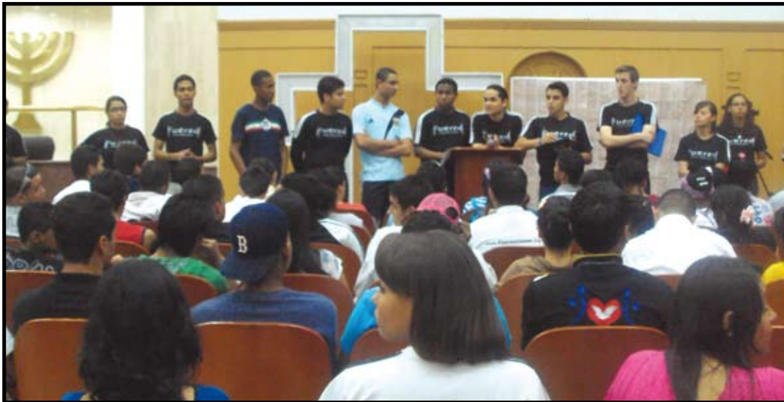
Los líderes de patrullas confirman asistencia

Sábado a sábado los jóvenes toman su espacio, poniendo a valer la energía y adrenalina que mueve a esta fuerza juvenil, es por ello que fueron tomadas las instalaciones de la Sede Nacional, para realizar las actividades pautadas para ese día.