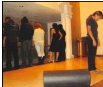
Pieza Teatral "Mi segunda oportunidad"