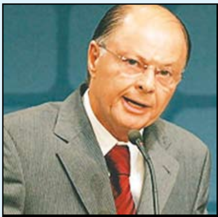
Obispo Macedo www.obispomacedo.com

Escrito está: “Sin embargo, hablamos sabiduría entre los que han alcanzado madurez; y sabiduría, no de este siglo, ni los príncipes de este siglo, que perecen”. (1 Corintios 2:6).