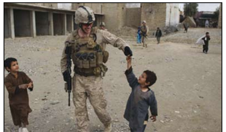
Un soldado juega con dos niños afganos en Musa Qala (Afganistán).