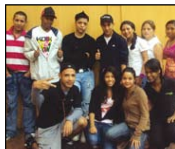
Jóvenes asistente a la tarde de reunión