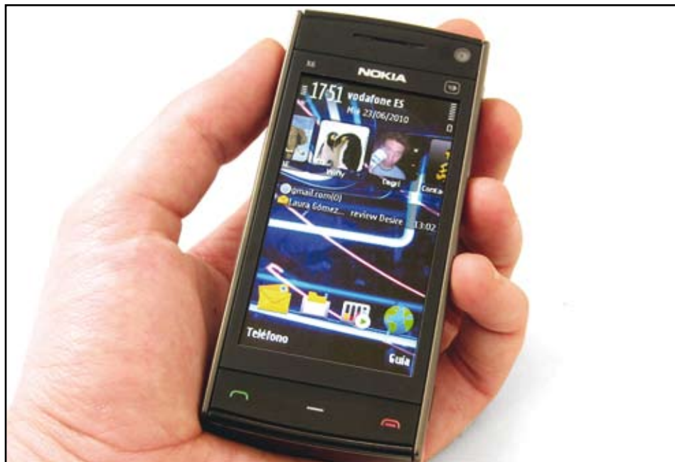
Nokia ha visto caer dramáticamente su cuota de mercado.

El nuevo director ejecutivo de Nokia envió un memorándum a sus empleados en el que admite que el gigante telefónico está en crisis.