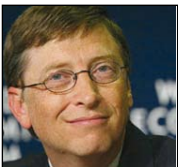
William Henry Gates

7- Antes de entrar a casa, deje sus problemas afuera de la puerta de entrada