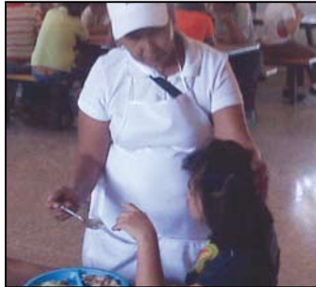
Una de las pequeñas pacientes siendo atendida

Fue una tarde muy amena en la que se les brindó cariño y los más importante se les realizó oraciones en su favor y un mensaje de fe para fortalecer sus corazones a través de la Palabra de Dios.