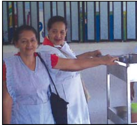
Trasladando la comida