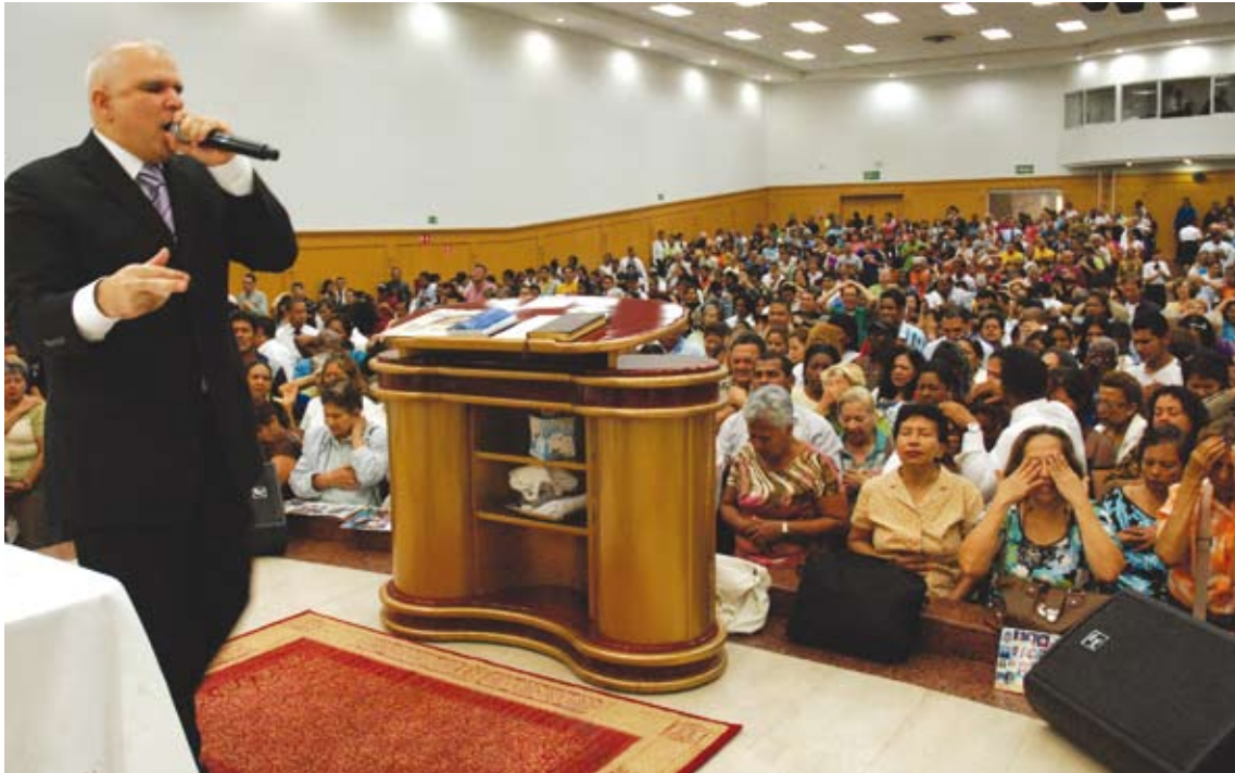
Oración dirigida para la salvación.

En San Lucas 16:19-31 está escrito así: “Había un hombre rico, que se vestía de púrpura y de lino fino, y hacía cada día banquete con esplendor. Había también un mendigo llamado Lázaro, que estaba echado a la puerta de aquél, lleno de llagas, y ansiaba saciarse de las migajas que caían de la mesa del rico; y aun los perros venían y le lamían las llagas. Aconteció que murió el mendigo, y fue llevado por los ángeles al seno de Abraham; y murió también el rico, y fue sepultado. Y en el Hades alzó sus ojos, estando en tormentos, y vio de lejos a Abraham, y a Lázaro en su seno. Entonces él, dando voces, dijo: Padre Abraham, ten misericordia de mí, y envía a Lázaro para que moje la punta de su dedo en agua, y refresque mi lengua; porque estoy atormentado en esta llama. Pero Abraham le dijo: Hijo, acuérdate que recibiste tus bienes en tu vida, y Lázaro también males; pero ahora éste es consolado aquí, y tú atormentado. Además de todo esto, una gran sima está puesta entre nosotros y vosotros, de manera que los que quisieren pasar de aquí a vosotros, no