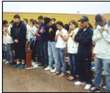
Buscando la presencia de Dios

Además de eso se presentó una obra de teatro titulada la segunda oportunidad, en donde los capitanes y tenientes de las patrullas, destacaron sus dotes histrionicos para dar vida a personajes que simulan los ataques que recibe la juventud hoy en día, los cuales se encargan de dañar y llevar al fracaso a la más valiosa creación de Dios: ¡Tú!. El mensaje principal de esta obra fue dar a conocer la importancia de mantenerse en los brazos de Dios, el cual es el único escudo y protección para resguardarse de estos males. En medio de los aplausos, la fe, la alegría y la hermandad, culminó otra tarde más de Fuerza Joven.