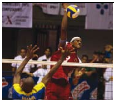
La Liga Nacional de Voleibol (Linavol)