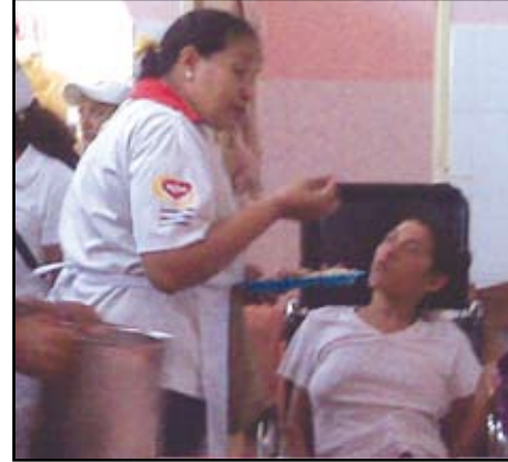
Voluntaria alimentando a una paciente